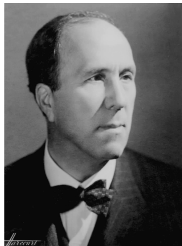
乔治·苏里耶·德·莫朗

苏氏这十年的中国经历对其今后“法国针灸之父”地位有决定性意义。苏氏在其 1939 年出版的《中国针术》(法文书名直译:中国针术;作者手书中文名:针灸法)前言中讲